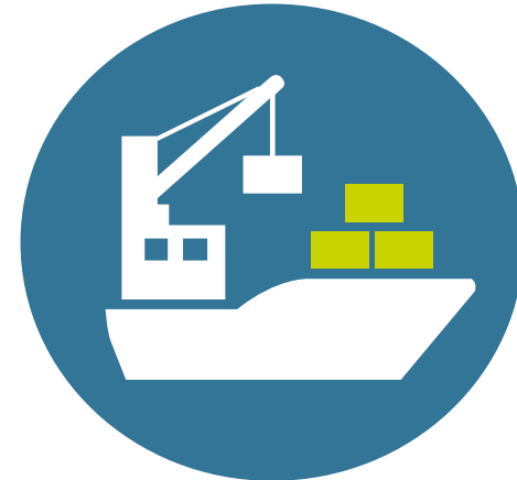
LOGISTICA DELLA CHIMICA